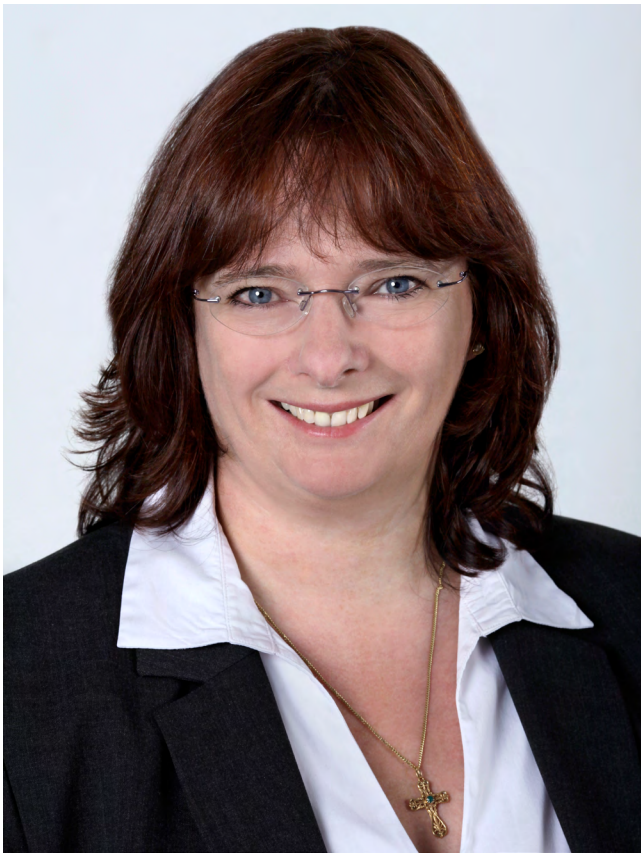
Elisabeth Roegele, Exekutivdirektorin der Wertpapieraufsicht

← Frau Roegele, durch das Kleinanlegerschutzgesetz hat die BaFin weitere Kompetenzen erhalten. Sie hat nun unter anderem die Möglichkeit der Produktintervention. Welche Bedeutung hat dies für die Aufsicht der BaFin?