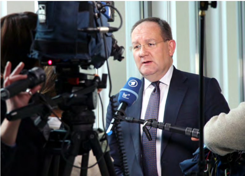
BaFin-Präsident Felix Hufeld im Gespräch mit Journalisten