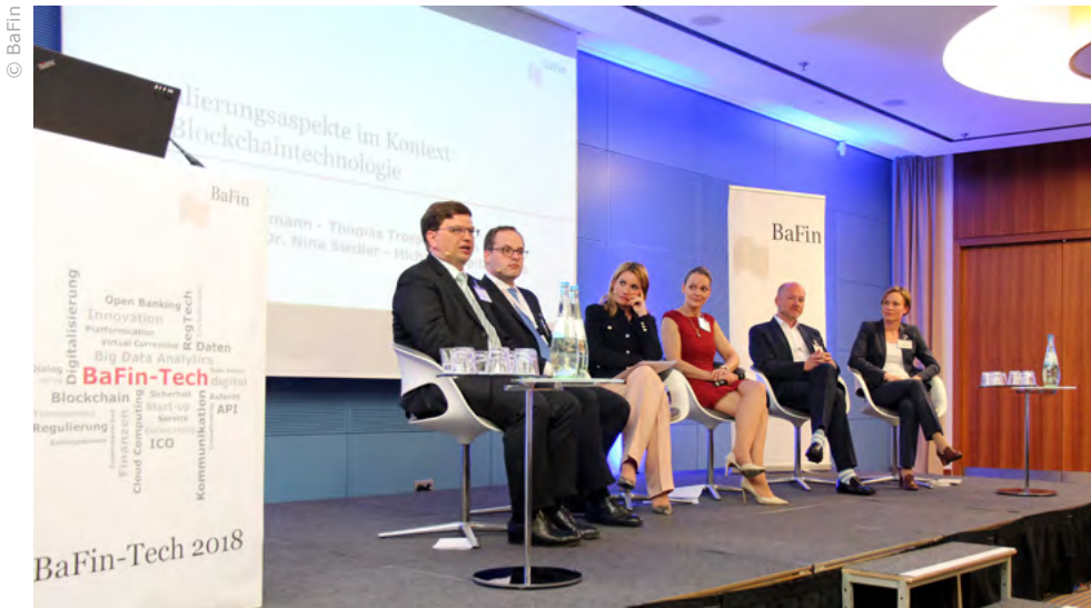
Diskussionsrunde zum Thema Blockchain