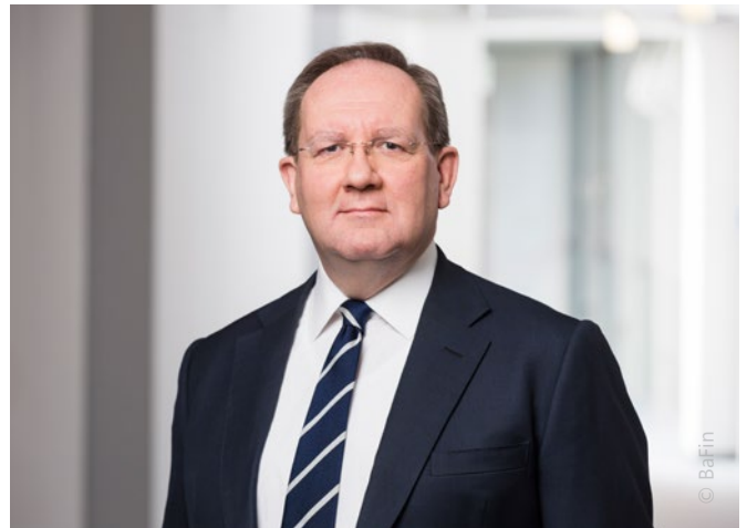
Felix Hufeld, BaFin

“ Die Art und Weise, wie Finanzdienstleistungen erbracht werden, wird sich grundsätzlich verändern.“