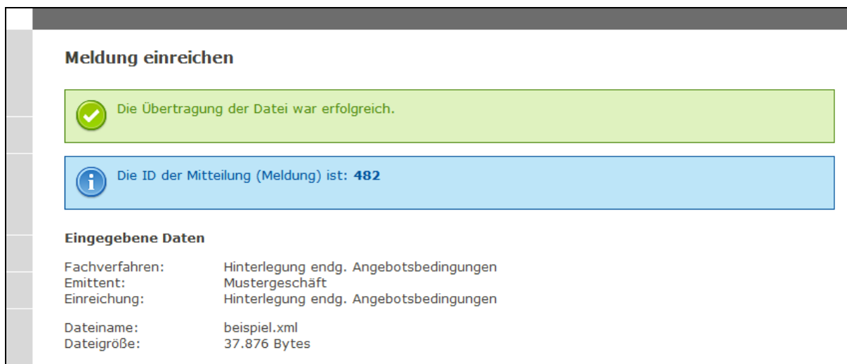
Abbildung 2: Erfolgreiche Übertragung